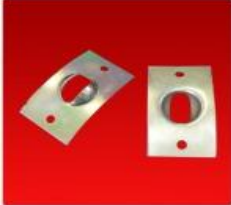
Juego Porta Rotula