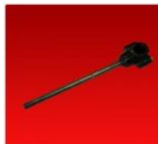
Pua Sinfin 1200 C/Safe-Seguro