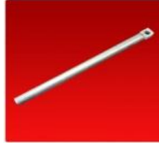
Dedo Escondible Vassalli 1500