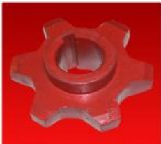
Engr.Noria 514063 c/Cha. 6D-D30