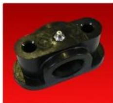
Cojinete Eje Diam. 30mm