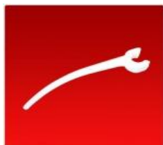
Pua Red.Reforzada Blanca 28mm.