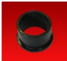
Buje con Pestaña Diam. 35 mm.