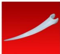
Pua Simple Blanca Diam. 28mm.