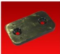
Guia de Zarandon