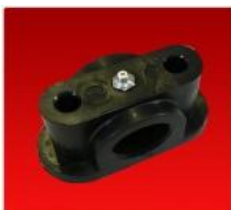
Cojinete Eje 35 mm.