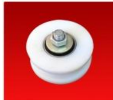
Tensor C/ Bulón Macho 1025519