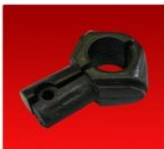
Bancada Partida Diam. 26mm.