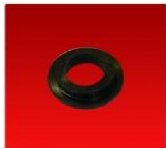
Buje con Pestaña Sojero