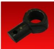
Bancada Molinete Convencional