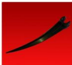
Pua Simple Negra Diam. 28mm.