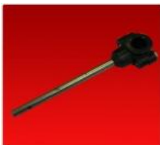
Pua Sinfin Partida 316/900/910