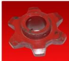
Engr.Noria 10-17626 c/Pas 6D-D30