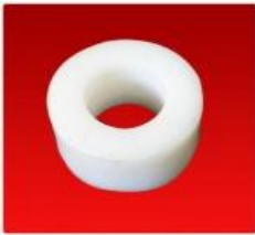
Tensor Diam. 85 mm