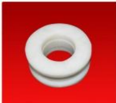
Tensor C/ Aletas 102519