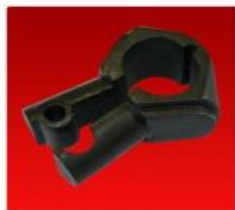
Bancada Partida Diam. 28mm.