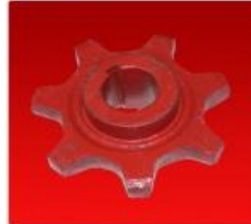
Engr.Noria 10- 17626c/Cha 7D-D30