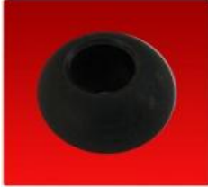
Esfera Vasalli 316/900