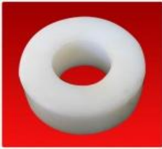
Tensor Diam. 100 mm