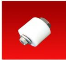
Tensor 10-16862 C/Bulón Hembra