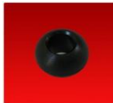
Esfera Vassalli 1500