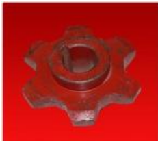
Engr. c/Cha. 6D-D25