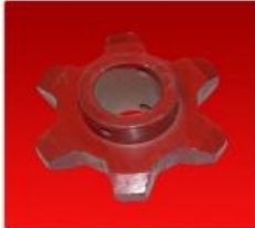
Engr.Noria 10- 17587c/Pas. D30