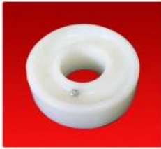
Tensor Diam. 100 mm C/ Alemite