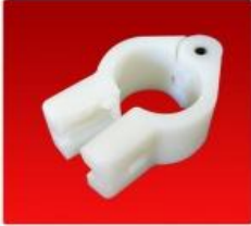
Bisagra Diente Escondibles