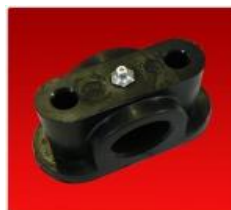
Cojinete Eje Diam. 33mm