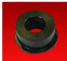
Buje con Pestaña Excentrico