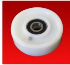
Tensor D100mm C/Alem. Completo