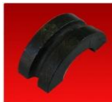
Bancada Punta Estrella Redonda