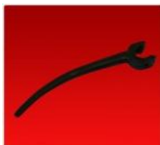
Pua Red.Reforzada Negra 28 mm.