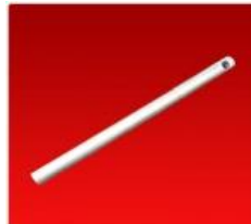
Dedo Vassalli Agujero Grande