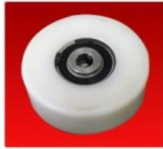
Tensor Diam. 100 mm Completo