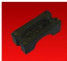
Bancada Punta Estrella Cuadr.