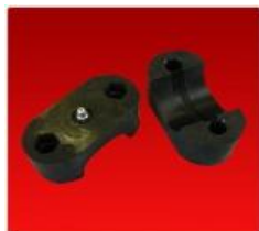
Juego Cojinete Diam. 42mm.