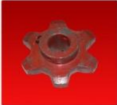
Engr.Noria 413563 c/Pas 6D-D25