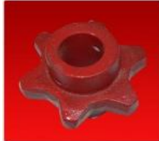
Engr.Noria 10- 17587c/Pas 6D- D30ML