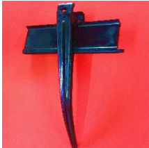
Púa p/ Vassalli 1550